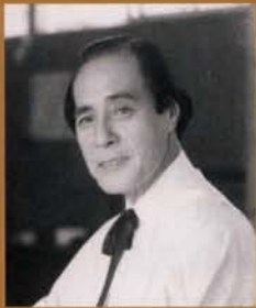
江口隆哉 (1900~1977) 青森県出身